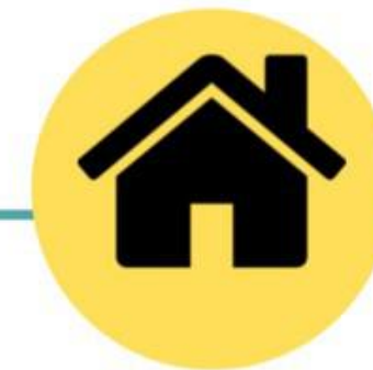
Gestión de ofertas