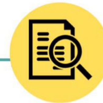
Preparación de documentación