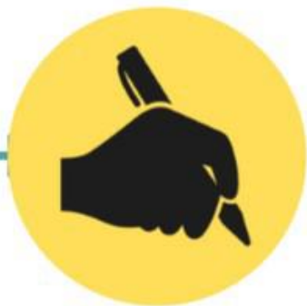
Cierre ante notario